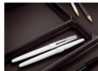
Auszugsfächerschale mit geräuschmindernder Anti-Rutsch-Bodenfläche.