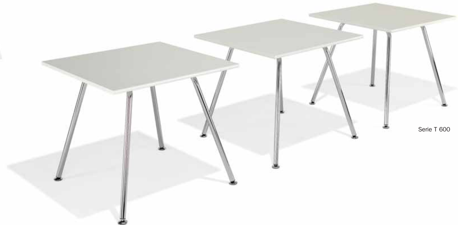
Serie T 600

Het fijne, naar boven toe A-vormige onderstel geeft deze tafels een fraai uiterlijk. Even geschikt voor vergaderingen, conferenties en cursussen als voor cafeteria's en verblijfruimtes. Design: Prof. Stefan Lengyel.