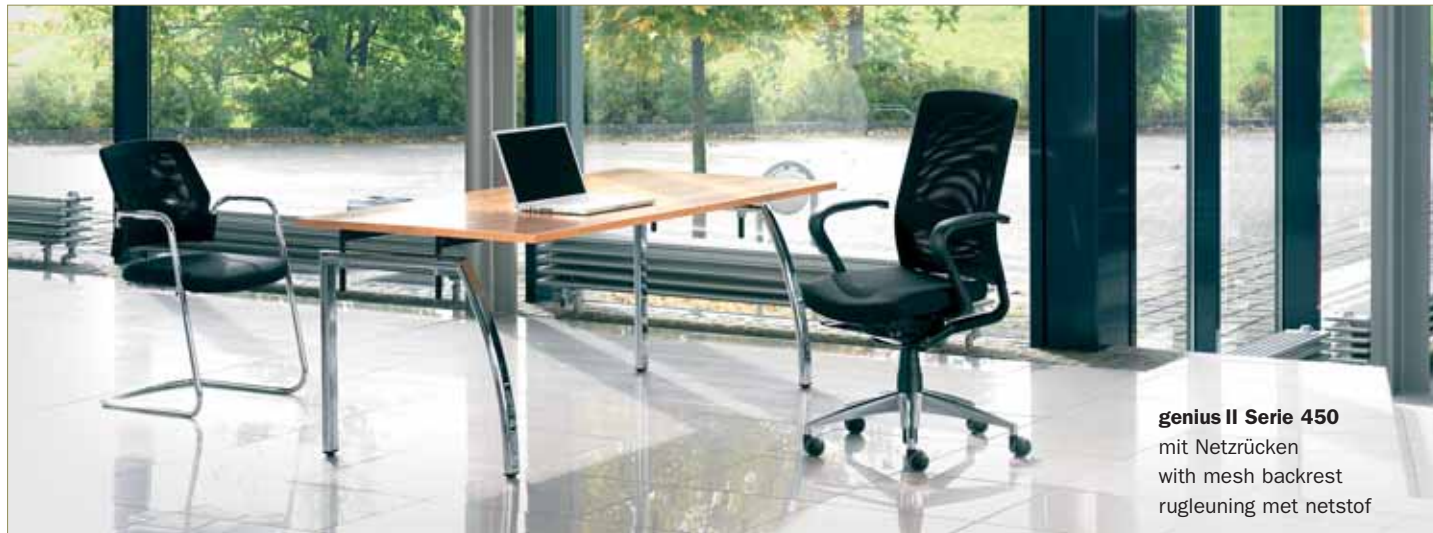
genius II Serie 450 mit Netzurücken with mesh backrest rugleuning met netstof

genius II Serie 450 chilla Serie 535, chilla swing Serie 536 Serie 210/211, Serie 220/221 Tische T 600